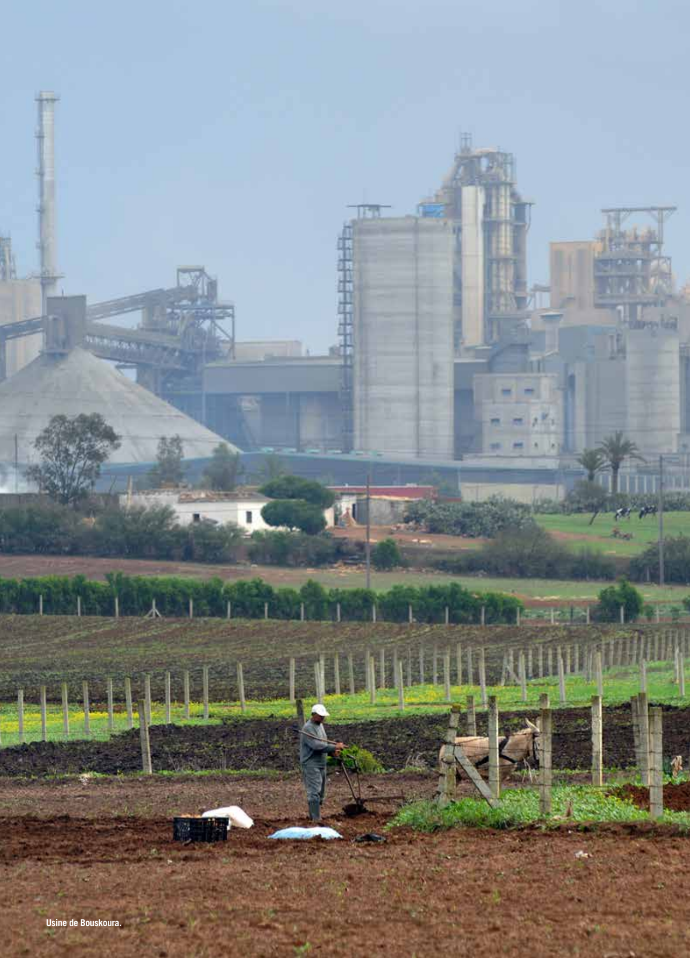
Usine de Bouskoura.