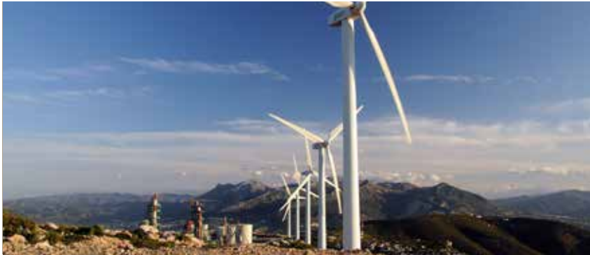
Usine et parc éolien de Tétouan.

L a responsabilité ne se limite pas aux émissions de CO 2 : il est aussi du devoir de Lafarge Maroc de réduire ses émissions indirectes.