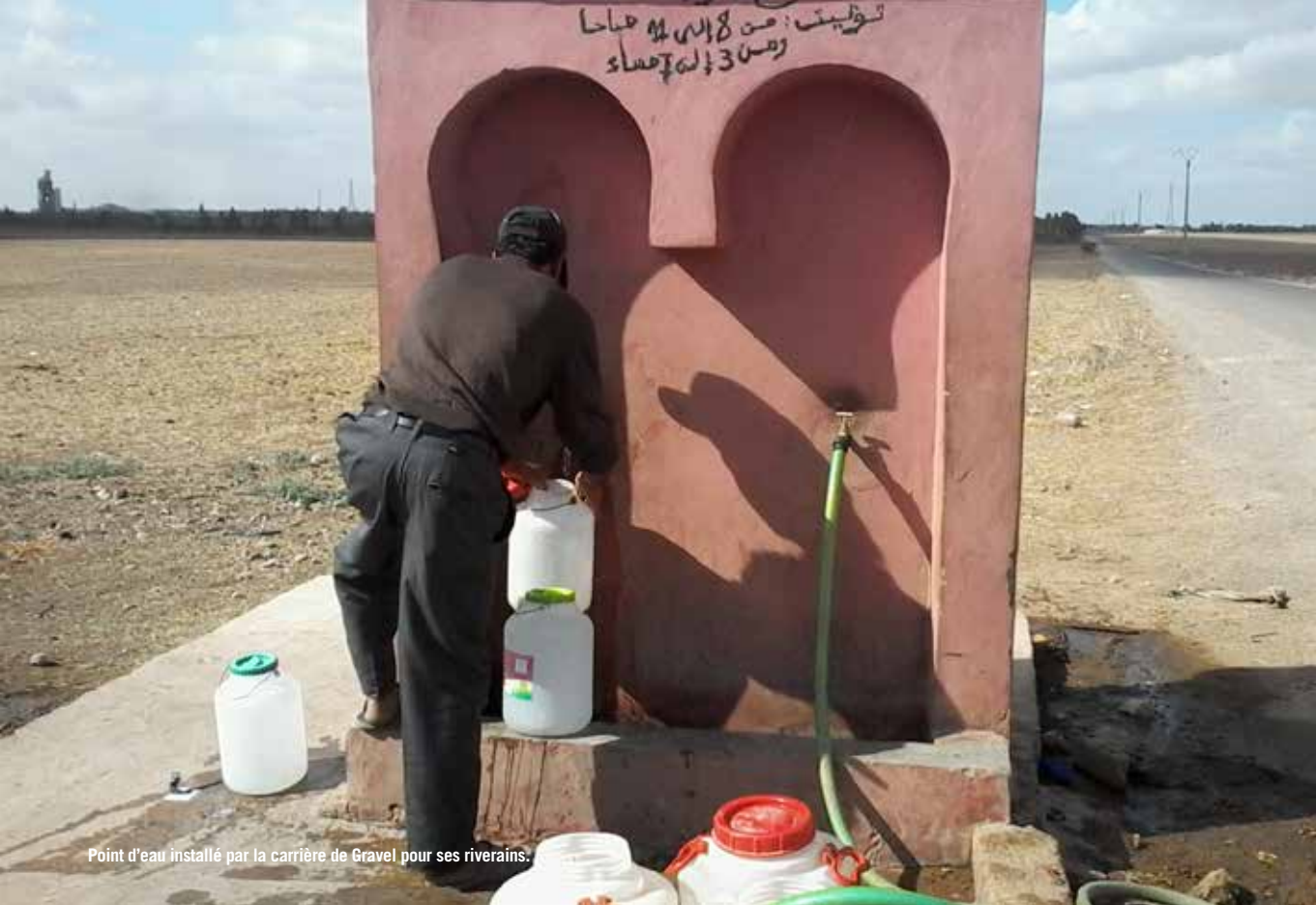
Point d'eau installé par la carrière de Gravel pour ses riverains.