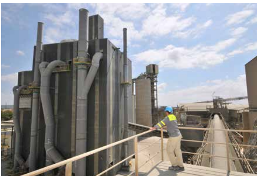
Usine de Tanger.

par rapport à 1990 grâce à un modèle opérationnel d'excellence permettant l'amélioration en continu de la fiabilité et de l'efficacité énergétique. En 2014, la totalité des cimenteries de Lafarge Maroc a franchi une étape supplémentaire. Elles ont été parmi les premières du Groupe à recevoir le label « POM 2.0 Inside » (nom du programme d'excellence des cimenteries du Groupe), marquant la mise en place des meilleures pratiques, notamment dans les domaines de la consommation énergétique, du remplacement des combustibles conventionnels par ceux issus de déchets industriels, ménagers ou agricoles (dans toutes nos cimenteries), de l'utilisation de matières d'ajouts permettant de réduire le volume de clinker nécessaire à la fabrication du ciment et enfin, du développement d'énergies renouvelables.