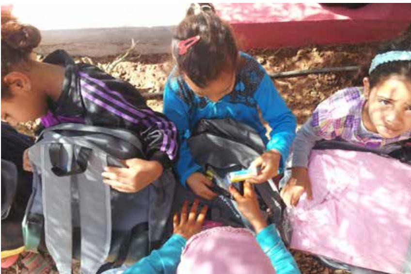
Distribution de fournitures scolaires - Projet de cimenterie Sous

écoliers et collégiens ont bénéficié de l'opération cartables à la rentrée 2014.