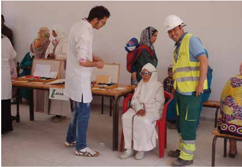
Caravane médicale pour les riverains - Dépistage ophtalmologique