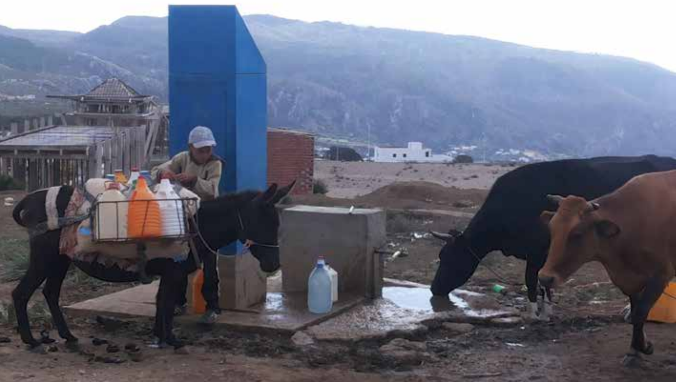
Fontaine construite par l'usine de Tétouan pour les habitants de la commune de Saddina