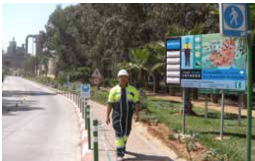
Usine de Bouskoura.