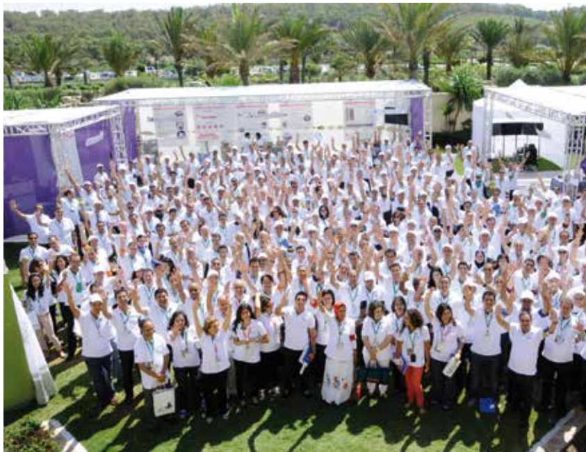
Collaborateurs de Lafarge Maroc.