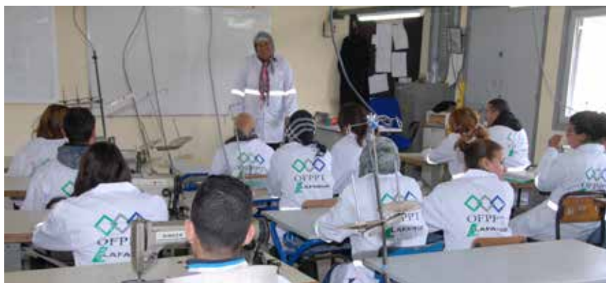
Partenariat OFPPPT - Lafarge : Atelier coupe et couture à Meknès

réalisations autour de nos sites en faveur de l'employabilité en 2014 au bénéfice de 668 personnes.