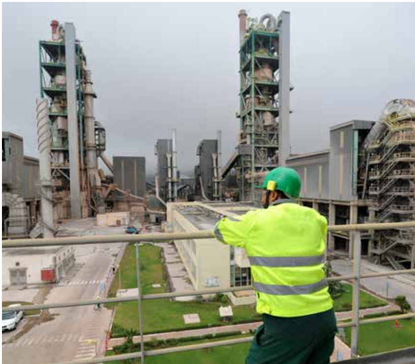
Usine de Tétouan

Nous poursuivons depuis plus de vingt ans d'ambitieux objectifs pour réduire notre impact sur les ressources naturelles et diminuer notre impact carbone. Produire plus et mieux en préservant l'équilibre de notre environnement est une priorité quotidienne de l'ensemble des sites de Lafarge Maroc.