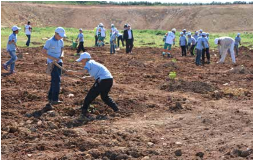
Opération de plantation par les enfants du personnel de l'usine de Meknès

N otre engagement en faveur de la protection de l'environnement a été formalisé en 1997 par la signature d'une convention avec le Ministère de l'Environnement. Selon les termes de cette convention, Lafarge Maroc s'engage à remettre en état les sites et carrières exploités. En amont, chaque projet de développement fait l'objet d'une étude d'impact environnemental permettant d'identifier les investissements et les actions de nature à limiter l'impact sur l'eau, l'air, le sol et la biodiversité. En aval, les plans de réhabilitation sont élaborés par un bureau d'étude spécialisé et sont réalisés au fur et à mesure de l'avancement de l'exploitation.