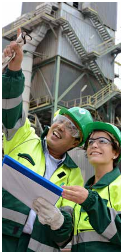
Collaborateurs de l'usine de Tétouan

Des campagnes de sensibilisation ont également été réalisées à destination des collaborateurs et chauffeurs de taxi pour garantir la sécurité des déplacements de personnes.