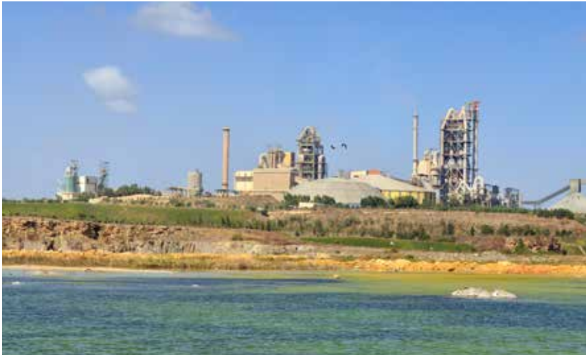
Carrière de la cimenterie de Bouskoura.

D ans un contexte marocain de stress hydrique et conformément à l'engagement pris par le groupe Lafarge dans le cadre de ses Ambitions 2020, les initiatives en faveur de la gestion de la ressource hydrique se sont multipliées au sein de Lafarge Maroc. Un vaste projet d'étude relative à l'eau et à sa préservation a été engagé.