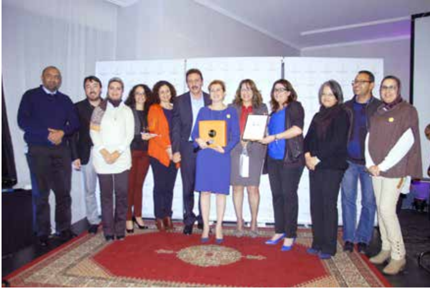
Lafarge Maroc reçoit le prix du « Meilleur Employeur 2014 » dans le domaine industriel.