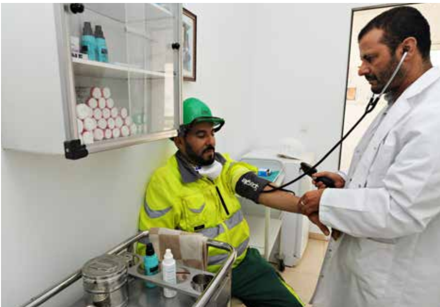
Contrôle médical à l'infirmerie de l'usine de Tétouan.

Le développement économique et l'amélioration des conditions de vie des communautés au sein desquelles nous opérons fait partie de nos enjeux stratégiques. Cet engagement citoyen et responsable, conçu avec les acteurs locaux, nous permet d'ancrer nos activités dans la durée.